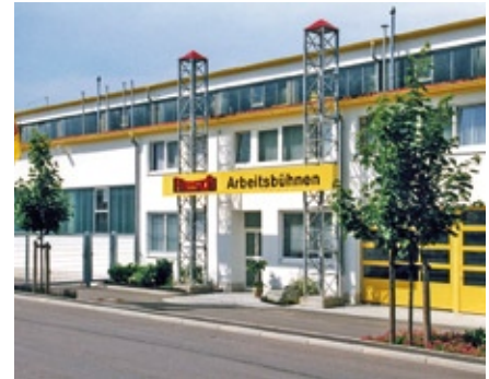
Mit einem modernen Dienstleistungs- und Vertriebszentrum am Hauptstandort Tuttlingen in der Daimlerstraße 5-7 präsentiert sich die Flesch Arbeitsbühnen GmbH & Co. KG.