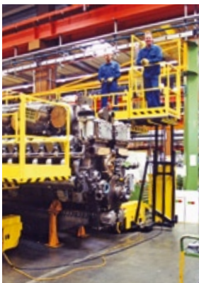
Die Flesch-Arbeitsbühnen erfüllen die höchsten Sicherheitsansprüche und eignen sich für die vielfältigsten Einsätze.

nungszeiten sind montags bis freitags von 7 bis 19 Uhr und samstags von 7 bis 12 Uhr. Die Arbeitsbühnen-Selbstfahrer erhalten vor den technischen Einsätzen eine gründliche Einweisung durch das geschulte Fachpersonal des Flesch-Dienstleistungs-Zentrums. Bei technischen Notfällen ist das kompetente Flesch-Team außerhalb der Geschäftszeiten über die Service-Hotline + 49 (0) 74 61/ 96 10-29 jederzeit erreichbar.