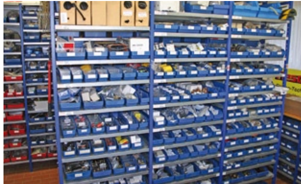
Das bestens sortierte und bestückte Ersatzteile-Lager unterstützt den optimalen und schnellen Kundendienst-Service.

N eben dem Vertrieb neuer Arbeitsbühnen gewinnt der Verkauf von gebrauchten Flesch-Arbeitsbühnen immer stärker an Bedeutung. Das ist ein Verdienst der hauseigenen Fachwerkstatt, die alle Voraussetzungen erfüllt, um gebrauchte Arbeitsbühnen wieder in neuwertigen Zustand zu bringen. Dem Kunde ist somit bei Kauf oder Miete von gebrauchten Arbeitsbühnen ein hoher Qualitäts- und Sicherheitsstandard gewährleistet. Zum Verkauf der Arbeitsbühnen hält die Firma Flesch einen flächendeckenden Kundendienst-Service mit gut bestücktem Original-Ersatzteilelager bereit. Innerhalb kürzester Zeit sind die Ersatzteile lieferbar und eine schnelle Instandsetzung ist möglich.