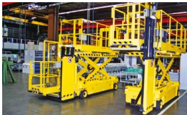
Sonderbühnen der Flesch Arbeitsbühnen GmbH & Co. KG bewähren sich im täglichen Praxiseinsatz.