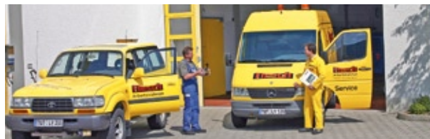
Das Flesch-Servicepersonal beim letzten innerbetrieblichen Check der Kundenauftragsbearbeitung.

Ein fachlich gut ausgebildetes und erfahrenes Personal garantiert für einen hohen Qualitäts- und Sicherheitsstandard des Maschinenparks der Flesch Arbeitsbühnen GmbH & Co. KG. Vor einem plötzlichen technischen Defekt oder Motorenschaden ist allerdings niemand geschützt. Deshalb haben wir für Sie auch den Notdienst-Service aufgebaut. Bei technischen Problemen am Einsatzort ist das Flesch-Notdienst-Auto schnell zur Stelle. Das qualifizierte Service-Team bemüht sich dann Vor-Ort um die zuverlässige Behebung der Mängel oder besorgt ein Ersatzfahrzeug. Bei Problemen und Störungen erreichen Sie die Service-Hotline unter Rufnummer + 49 (0) 7461/ 9610-29 .