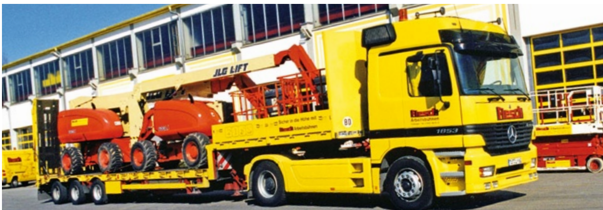
Mit Spezialfahrzeugen werden die Arbeitsbühnen an jeden gewünschten Einsatzort transportiert.

Das Flesch-Team kümmert sich selbstverständlich auch um den Transport der von Ihnen angemieteten Arbeitsbühne. Mit Spezialfahrzeugen und Spezialanhängern werden die Arbeitsbühnen zuverlässig an die gewünschten Einsatzorte transportiert. Die Anfahrt erfolgt nach persönlicher Rücksprache zum fest vereinbarten Termin.