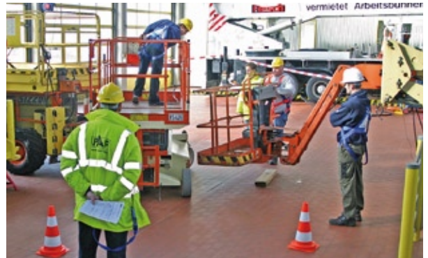
Die Arbeitsbühnen-Schulungen im Flesch-Trainingscenter erfolgen in Theorie wie Praxis nach IPAF-Geprüfter Unterrichtsmethodik.

Die Kursteilnehmer erwerben die Qualifikation für die Bedienung der geschulten Arbeitsbühnentypen und erhalten die PAL-Card. Die PAL-Card ist fünf Jahre gültig und gilt als Ausweis für den sicheren und befähigten Umgang mit dem entsprechenden Arbeitsbühnen-Modell. Die Schulung gliedert sich in Theorie- und Praxiseinweisungen. Im theoretischen Teil gibt es Informationen und Tipps rund um die Sicherheitsvorschriften, die Arbeitsbühnen-Modelle und die Bedienungsanforderungen. Im praktischen Teil muss das erlernte theoretische Wissen bei Fahrttests unter Beweis gestellt werden.