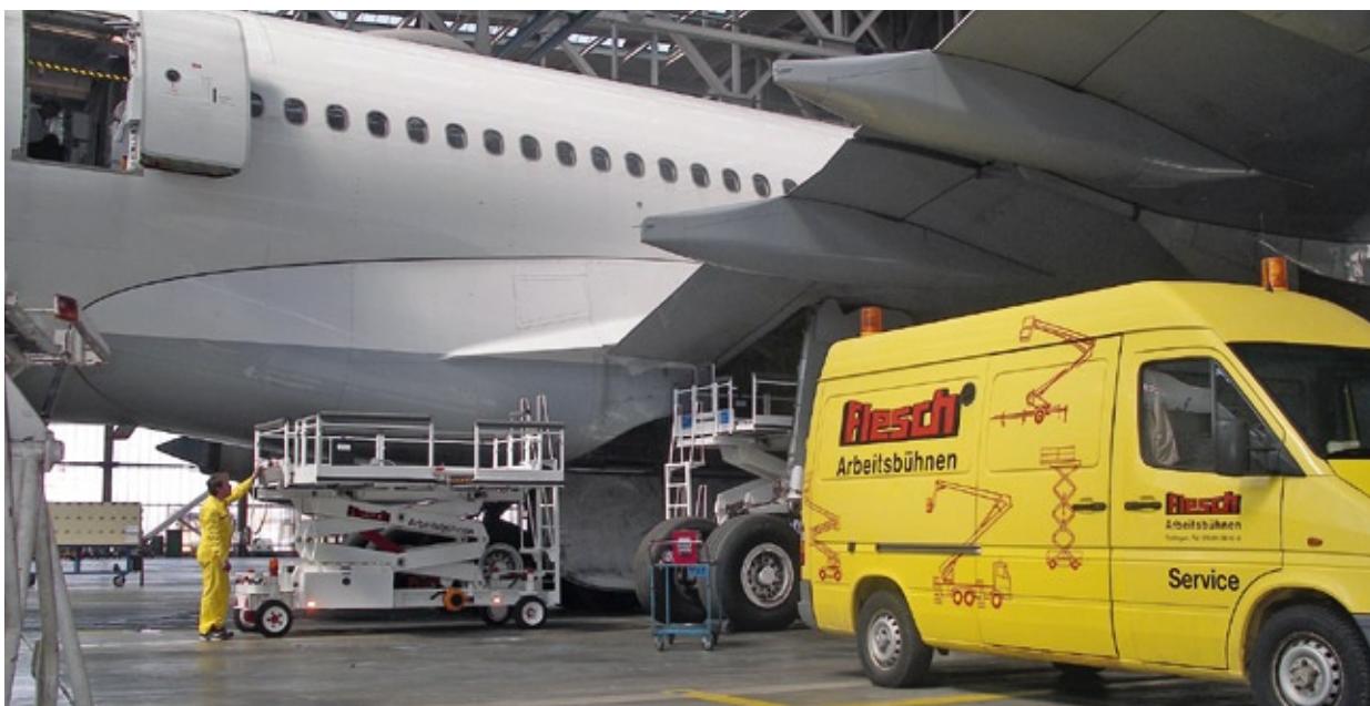
Für schwierige Arbeitseinsätze entwickelt die Flesch-Arbeitsbühnen GmbH & Co. KG technische Sonderlösungen. So werden Flesch-Spezialbühnen selbst im Fahrwerkschacht der Airbus-Baureihe den individuellen Anforderungen gerecht.