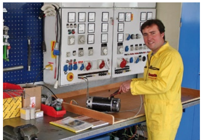
Im Arbeitsbühnen-Sektor wie in der Elektrotechnik setzt die Flesch Unternehmensgruppe auf zuverlässige Serviceleistungen.