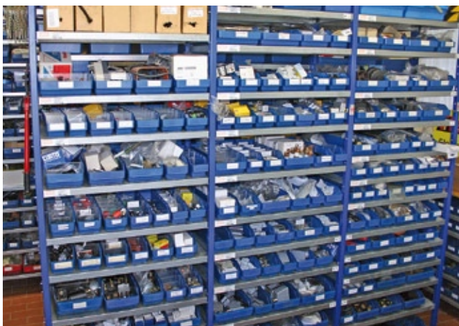
Das gut bestückte Ersatzteile-Lager unterstützt den optimalen und schnellen Kundendienst-Service.