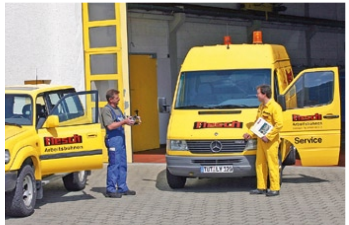
Das Flesch-Servicepersonal beim letzten innerbetrieblichen Check der Kundenauftragsbearbeitung.

Mit Qualität und Zuverlässigkeit punktet das bestens geschulte Flesch-Serviceteam. Wartungsverträge für den Arbeitsbühnen-Bestand namhafter Firmen und Hersteller unterstreichen die hohe Branchenkompetenz und das Know-how in der Höhenzugangstechnik.