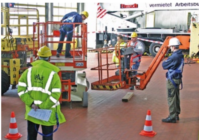
Für die effiziente Nutzung und sichere Anwendung von Arbeitsbühnen gewinnt das IPAF-Sicherheitstraining immer mehr an Bedeutung.

Kursmethode, Zielgruppe, Leistungsumfang, Schulungsort und Teilnahmegebühr können beim Flesch Schulungs- und Trainingscenter (Daimlerstraße 5-7, D-78532 Tuttlingen) jederzeit angefragt werden unter: