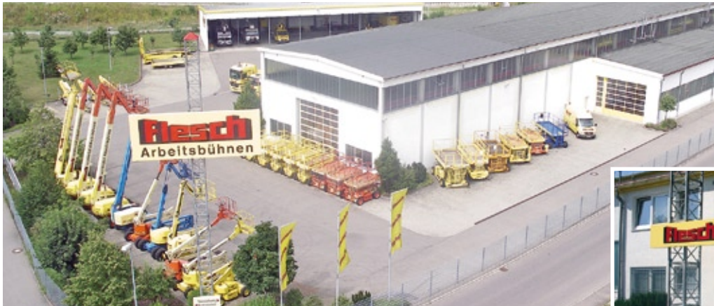
Mit einem modernen Dienstleistungs- und Vertriebszentrum am Hauptstandort Tuttlingen in der Daimlerstraße 5-7 präsentiert sich die Flesch Arbeitsbühnen GmbH & Co. KG.