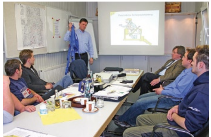
Die Arbeitsbühnen-Schulungen im Flesch Trainingscenter erfolgen nach IPAF-Geprüfter Unterrichtsmethodik.

Diese IPAF-Zertifizierung schafften bislang bundesweit nur wenige Unternehmen. Vier qualifizierte IPAF-Trainer schulen nach IPAF-Geprüfter Unterrichtsmethodik und garantieren Wissensvermittlung nach weltweit aktuellem Standard.