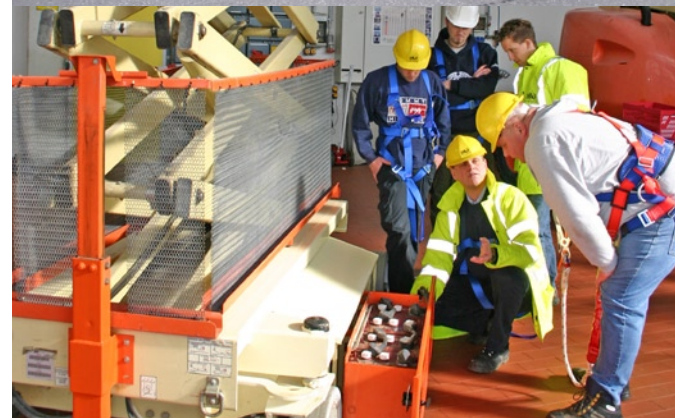
Für die effiziente Nutzung und sichere Anwendung von Arbeitsbühnen gewinnt das IPAF-Sicherheitstraining immer mehr an Bedeutung.