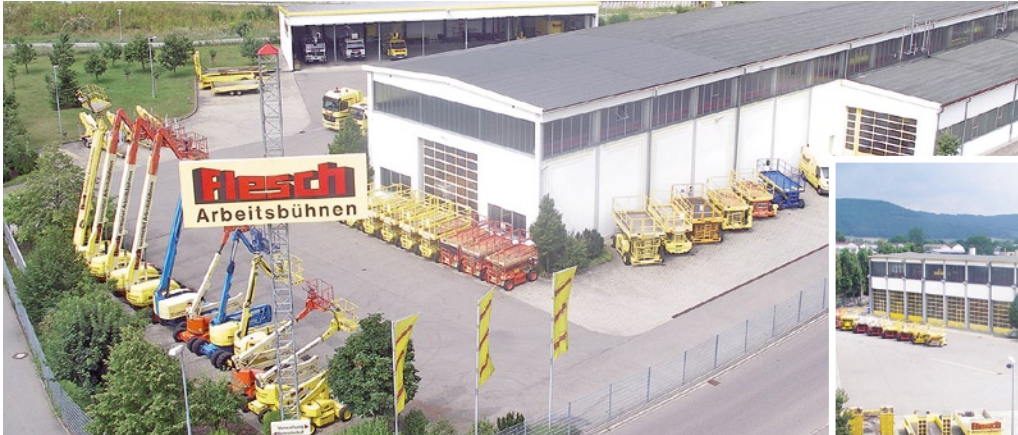
Mit einem modernen Dienstleistungs- und Vertriebszentrum am Hauptstandort Tuttlingen in der Daimlerstraße 5-7 präsentiert sich die Flesch Arbeitsbühnen GmbH & Co. KG.